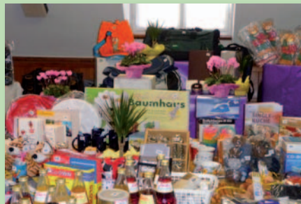
Die Tombola war ein großer Anziehungspunkt

denen Glücksvorstellungen noch die Seligpreisungen der Bergpredigt ins Spiel. Dort werden ja ganz andere Menschen glücklich gepriesen, als wir das gewohnt sind: Die geistlich Armen, die Trauernenden oder auch die Friedfertigen. Beim anschließenden Mittagessen platzte das Gemeindehaus aus allen Nähten und dank des wunderschönen goldenen Oktobersonntags waren auch die Plätze im Hof schnell besetzt. Auch die Kuchen und Crêpes mundeten vortrefflich. Für die Kinder war mit Schminken,