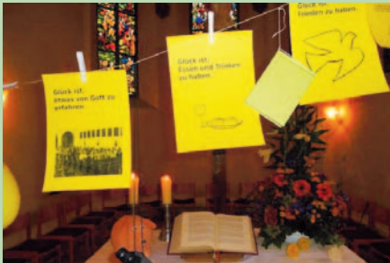
Das Thema „Glück“ zog sich durch den Tag

Bastelangeboten Langeweile ein Fremdwort. Orgelführung, Orgelkonzert, Turmbesteigungen, Tombola, Eine-Welt-Stand und das reiche Angebot des Bastelkreises rundeten das Programm ab. Der Tag fand seinen Abschluss durch eine Andacht zur Frage „Glück oder Unglück?“, bei der Pfarrer Olaf Digel auch die weisen Worte des Predigers zitierte, der