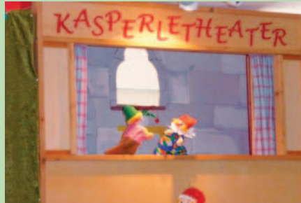
Das Kasperle erfreute Alt und Jung

Kasperle, Hüpfburg und Bungeerun, Erzählzelt der Kinderkirche und